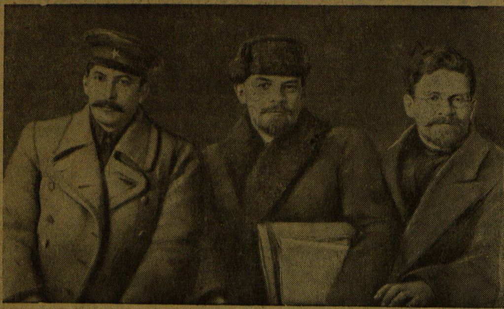
В. И. Ленин, И. В. Сталин и М. И. Калинин на VIII съезде РКП(б). Март 1919.

Директор электростанции тов. Олемский в своем письме на имя редакции подтвердил, что факты, указанные в газете, действительно имели место. Сейчас график снабжения «Домика Лермонтова» электроэнергией изменен, и свет в музее имеется круглые сутки.